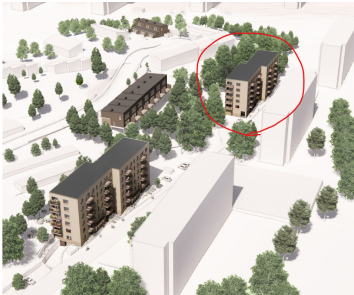
Bild 2, flygvy, placering av gruppbofastaden med röd markering.