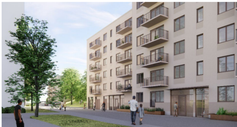
Bild 3, gatuvy, nordöstra Järnbärarvägen.